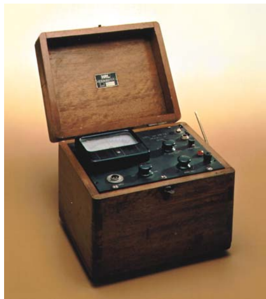
The Model H, the first pH meter from Horiba Radio Laboratory.

HORIBA: そのときに、私はアメリカにベックマンという世界的に有名な pH メーターのメーカーがあることを知りました。