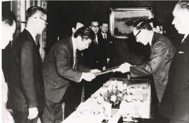
Horiba receives certification from the Osaka Stock Exchange.

Before the introduction of the zero-defect initiative, all of our customers more or less accepted the quality standards of our instruments because everybody purchased instruments of equal quality and was treated equally as customers. But, as the more stringent level of quality was introduced for the auto manufacturers, we provided it to our other customers as well. As a result, HORIBA, Ltd. experienced a dramatic cultural shift, a revolution so to speak, that resulted in a more rigorous emphasis on quality and reliability and led to the better performance of the company as a whole.