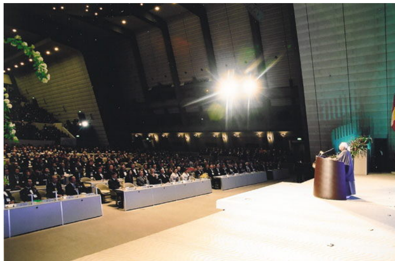
Horiba gives a lecture on management urging other business leaders to “let the nail stand out.”