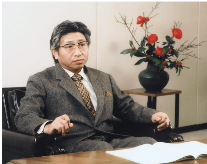
Horiba in 1974.

BROCK: Around 1973, the Ministry of International Trade and Industry wanted to develop a gas generator for use as a standard in evaluating the performance of the emissions analysis instruments. And you, Dr. Horiba, thought that a joint venture of several instrumentation companies should develop the standard rather than one single firm, which led to the creation of Standard Technology Company [Ltd.]. Was your idea of a joint venture among competitors controversial at that time?