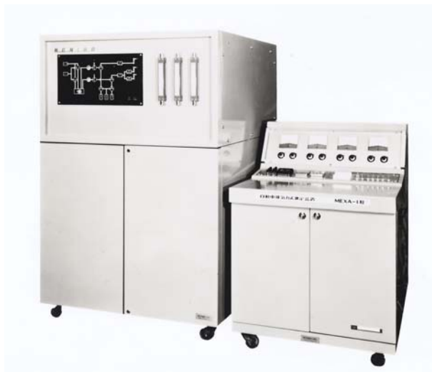
The MEXA-1, HORIBA, Ltd.'s first automobile emissions analyzer.