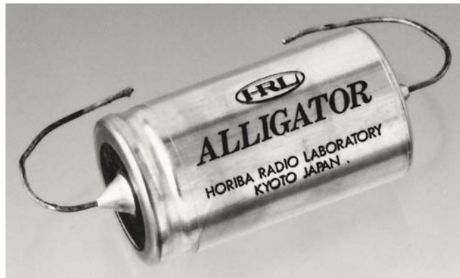
A component failure in an oscillator led Horiba to produce capacitors like this one.

INTERPRETER: After reading that book, I had to figure out how to extrapolate the kind of capacitor I required for commercial applications from the very basic capacitor I had created following the book's directions. I had to consider also the kinds of materials available to me here in Japan, as the materials described in the book were those available in the United States. I was not always able to acquire the same materials here in Japan, so I had to find some alternative materials and learn what differences existed between the American materials and my Japanese alternatives. I did all of those studies myself and eventually created a prototype capacitor.